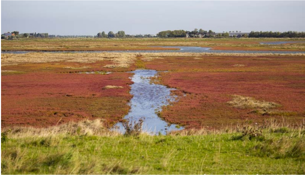
Plan Tureluur op Schouwen-Duiveland. Ditzelfde staat in de rest van Noord- en West-Nederland waaronder de bollenstreek te gebeuren, tenzij maatregelen worden genomen.